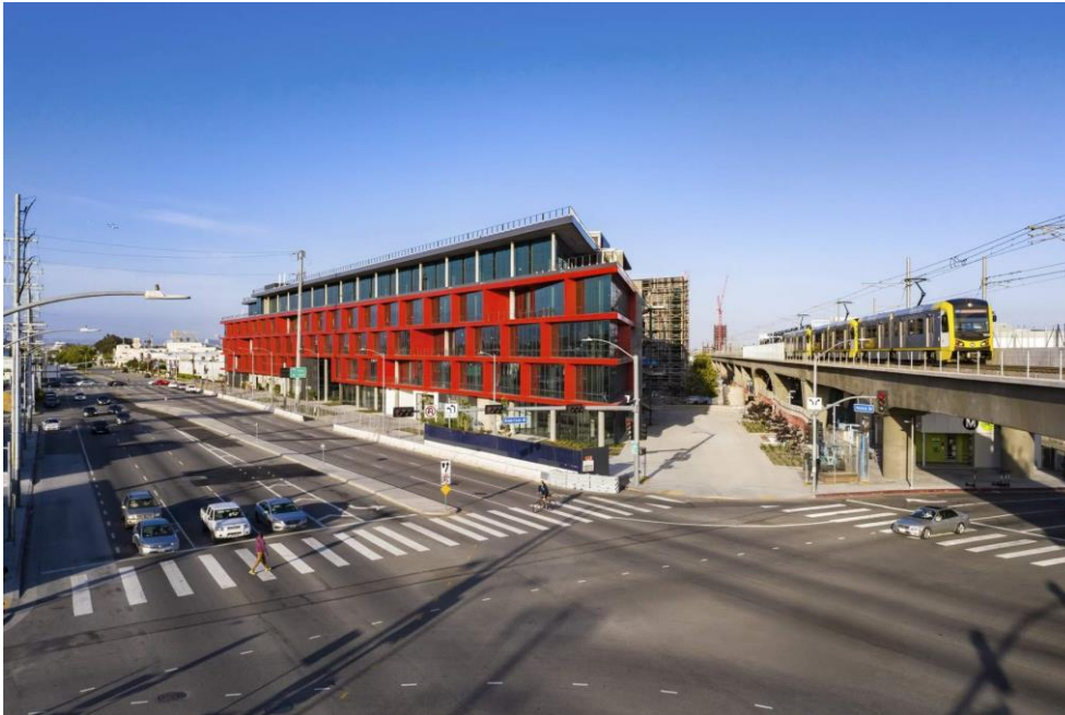
Das Bürogebäude der Ivy Station liegt direkt an der neuen U-Bahn-Linie von Los Angeles.