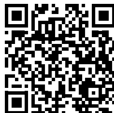
Sanierung im Zeitraffer - Vario LB Lachendorf Video