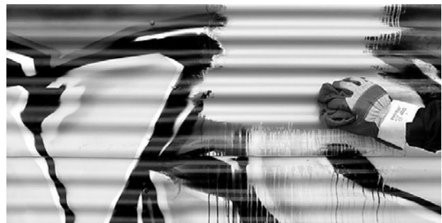
Während des Reinigungsvorgangs